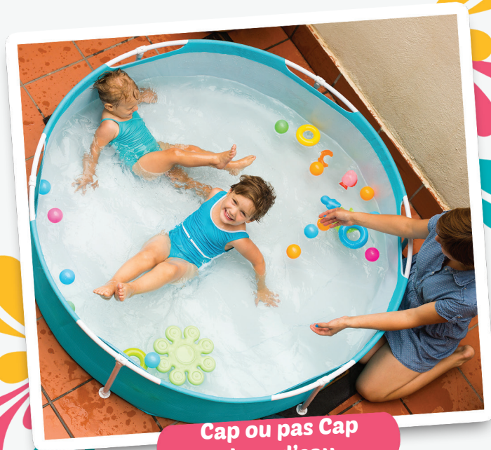
Cap ou pas Cap Jeux d'eau

Ces ateliers sous forme de pôles autour des jeux d'eau permettra aux plus petits de manipuler et d'expérimenter sous l'œil bienveillant de leurs parents.