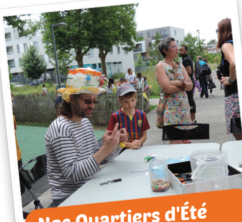
Nos Quartiers d'Été

Animations et temps festifs autour de l'environnement et de la citoyenneté