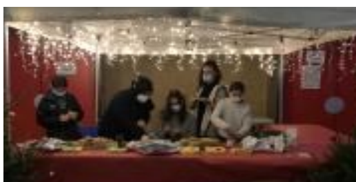
Salle Jacques Brel (décembre 2021)

80 CHEMIN ROUGE - BP 14 59155 FACHES THUMESNIL TEL : 03 20 88 32 02